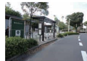
鹿大正門前バス停